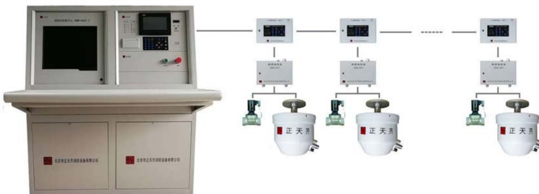
ZDMS0.6/5S-ZTQ-I 自动跟踪定位射流灭火装置接线示意图